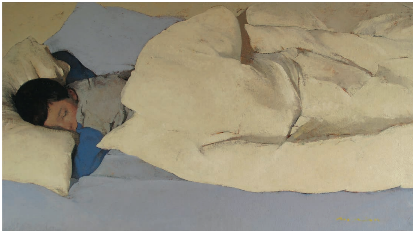
Somni en colors blau