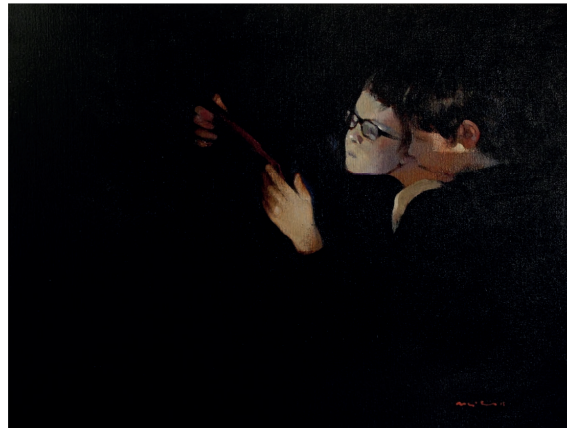
La llanterna màgica II