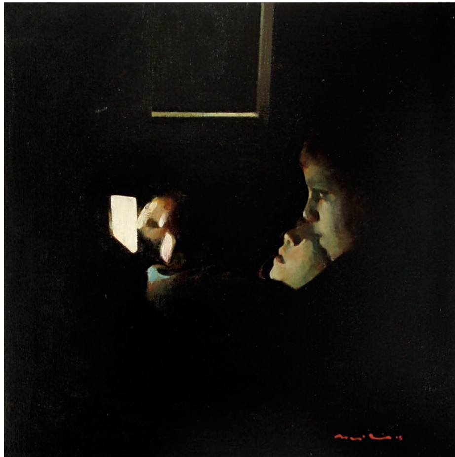
La llanterna màgica