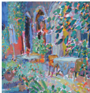
👤 Kirsten Bøgh